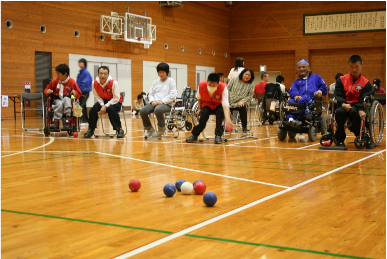
兵庫県交流ポッチャ大会に出場。伊丹ポッチャクラブと対戦。（関連記事2面）

発行 岡山ポッチャ クラブ 〒703-8555 岡山市北区祇園 866 TEL 086-275-3216 FAX 086-275-5641