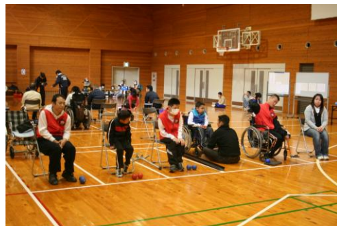
予選リーグで昨年の優勝チーム(フレスコ)と対戦