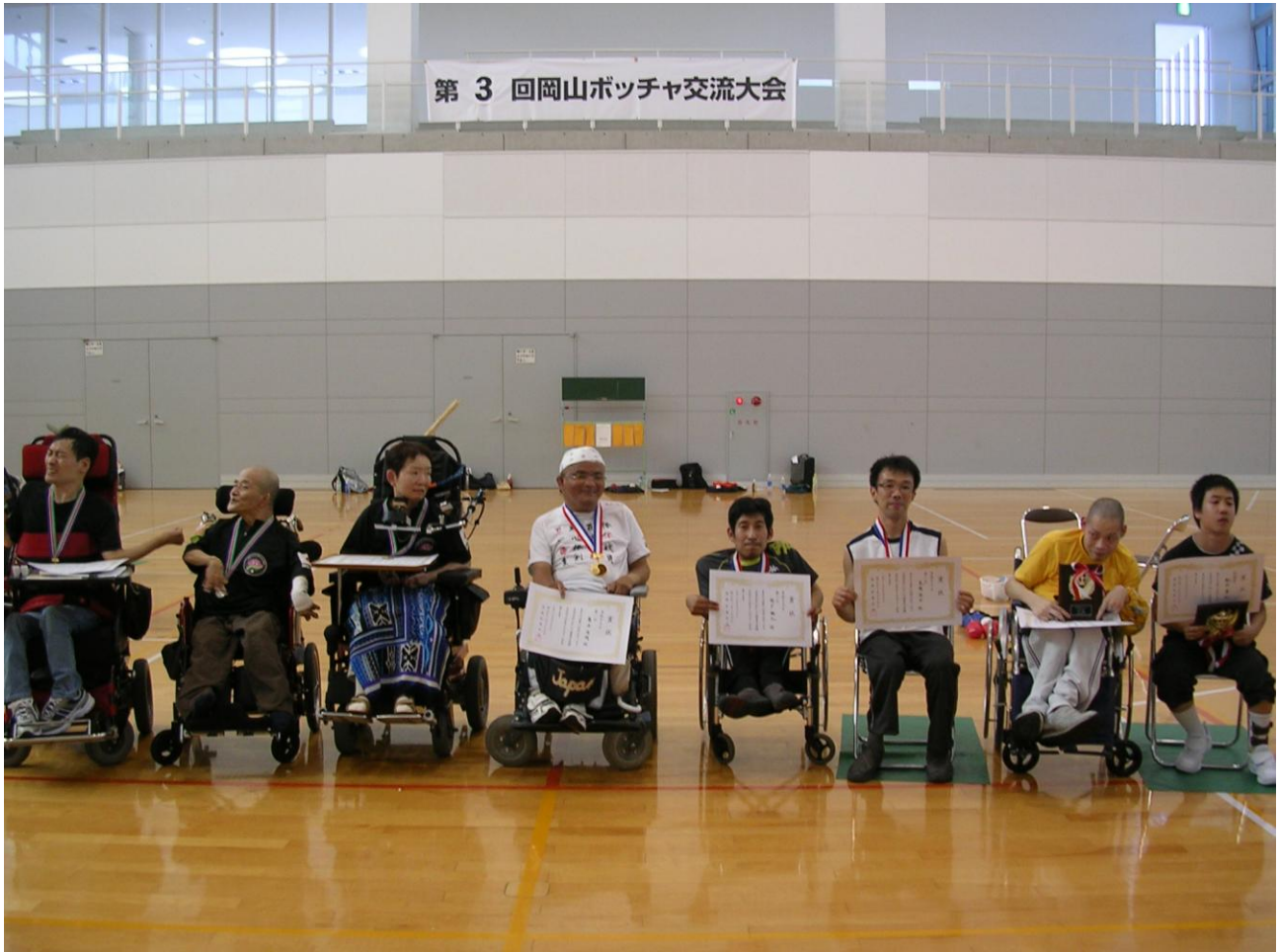
受賞された選手の皆様(詳細は4面)

発行 岡山ボッチャ クラブ 〒703-8555 岡山市北区祇園 866 TEL 086-275-3216 FAX 086-275-5641 http://www.tatsunoku-chiryu.org/bocciclub/index.html